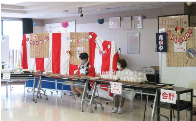
2023年8月3日(木)、13時30分～15時30分の2時間、開催しました。